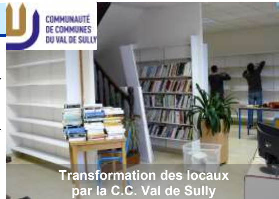
Transformation des locaux par la C.C. Val de Sully